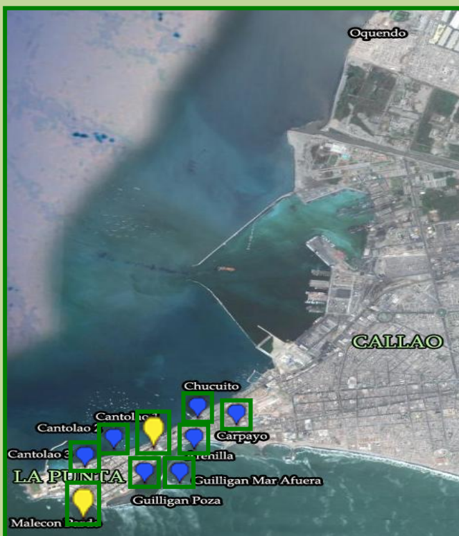
CALIDAD SANITARIA DE LAS PLAYAS DEL CALLAO VERANO 2010